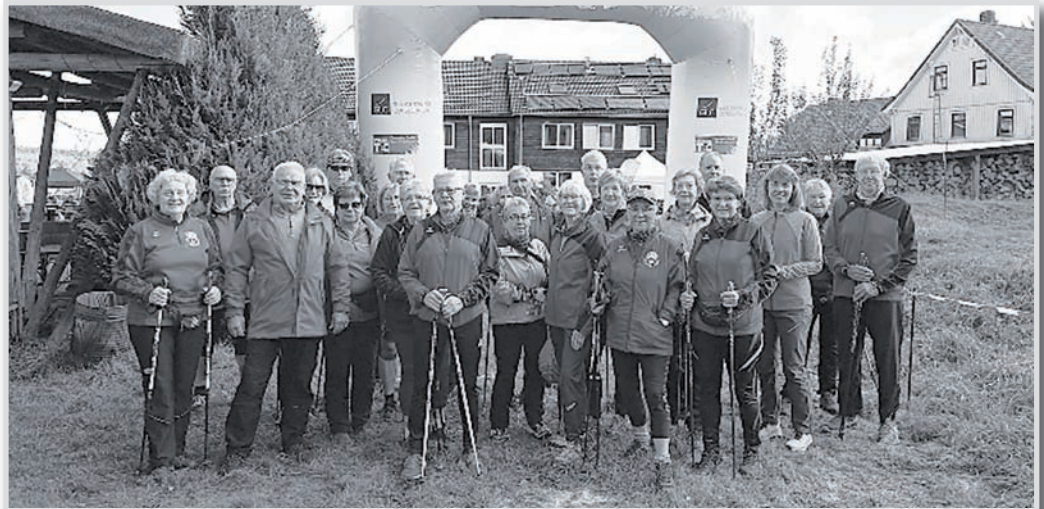
Endveranstaltung „nordic aktiv cup“ in Altenau.