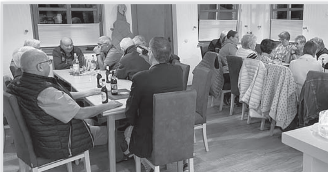
Unsere „Jedermänner/Frauen“ hatten am 19. September 24 die Mitglieder mit Partnern zu einem harmonischen Grillabend in das Tennisheim am Schildau-Sportpark eingeladen.