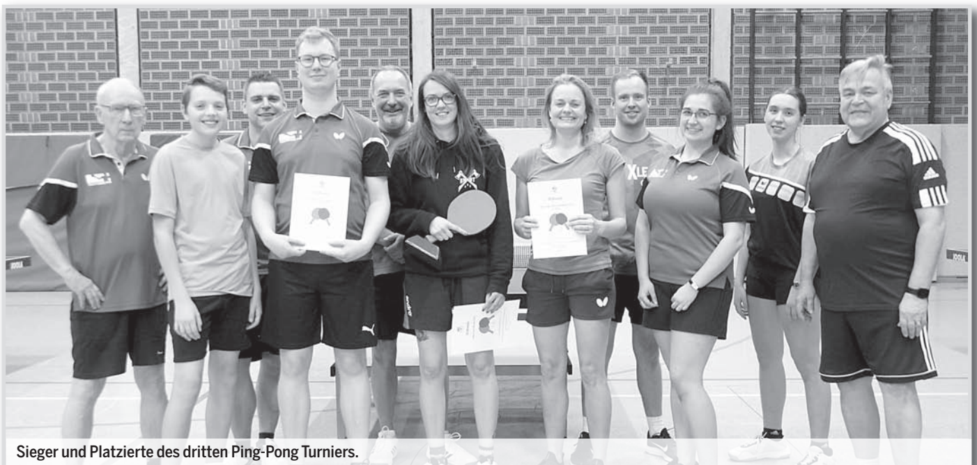
Sieger und Platzierte des dritten Ping-Pong-Turniers.

Zum Jahresabschluss wurde dann die traditionelle Weihnachtsfeier der Abteilung durchgeführt, diesmal im MTV-Treff: Bei gutem Essen und bester Stimmung ließen die MTVer hier das Jahr gemeinsam ausklingen. Axel Henniges