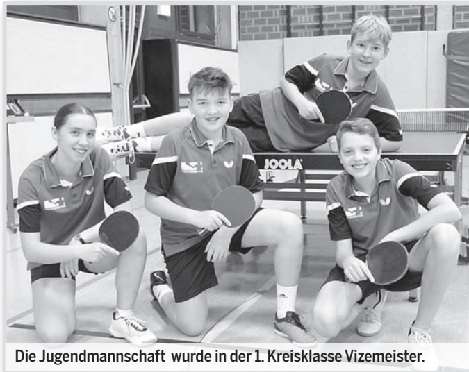
Die Jugendmannschaft wurde in der 1. Kreisklasse Vizemeister.

Die 3. Mannschaft landete letztlich mit 4:8 Punkten den 5. Platz in der 4. Kreisklasse. Bleibt zu hoffen, dass in der Rückserie „noch eine Schippe draufgelegt werden kann“. In richtig guter Form präsentiert sich wieder einmal die Jugendmannschaft der TT-Abteilung: in der 1.