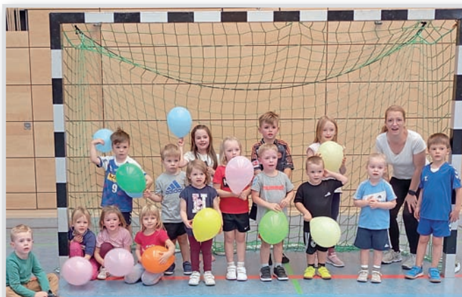
Die Mini-Handball-Gruppe ab drei Jahre.

Last but not least möchten wir uns bei allen Unterstützern auf diesem Wege ganz herzlich bedanken. Jeder, der dabei ist und