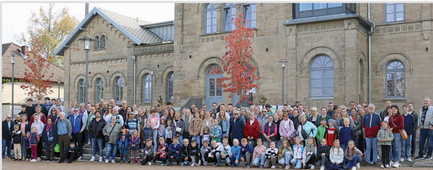
Die MTV Handballer unterwegs zu einem Spiel der Handball-Bundesliga.