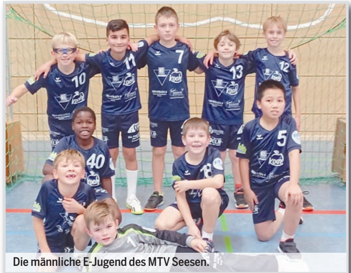
Die männliche E-Jugend des MTV Seesen.