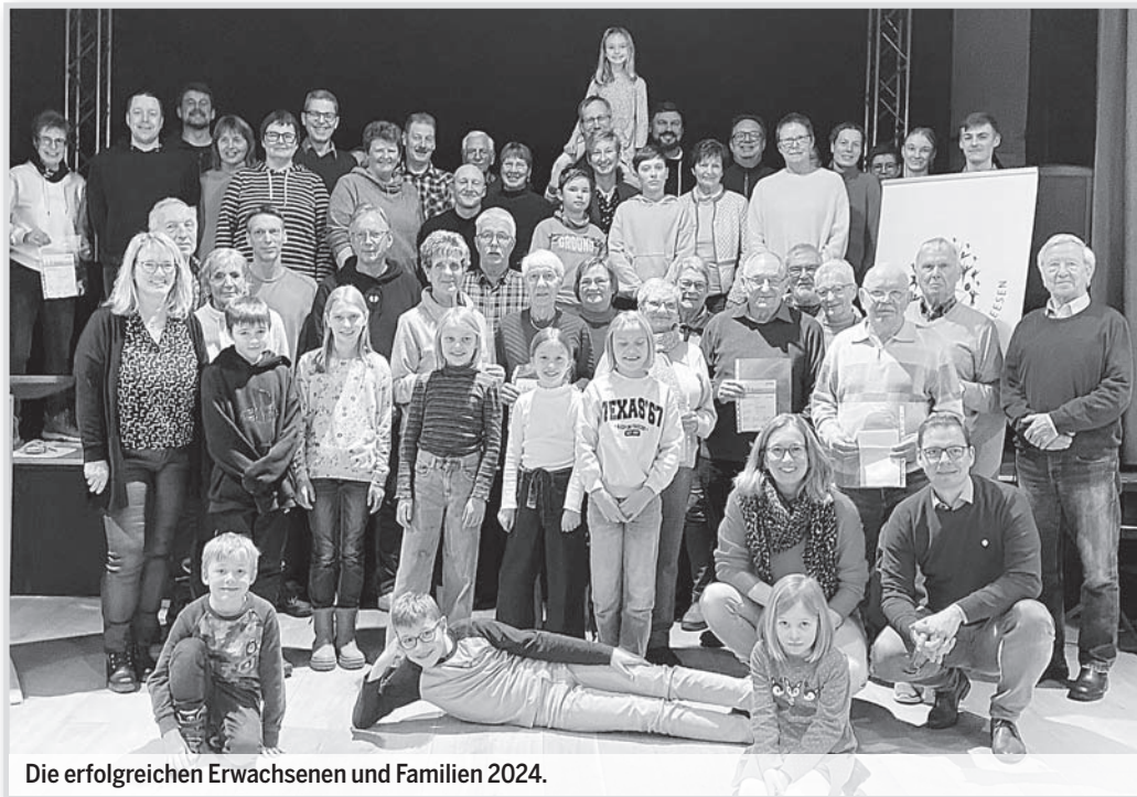
Die erfolgreichen Erwachsenen und Familien 2024.