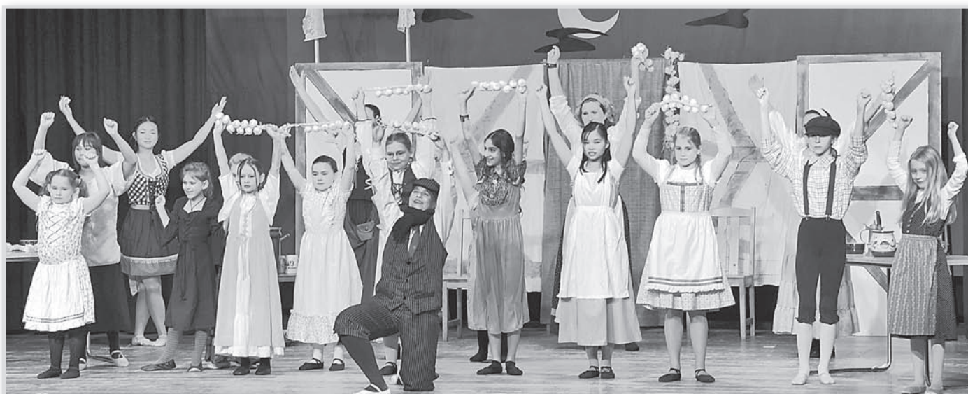
Wozu brauchen die hier alle Knoblauch? Die Ballettgruppe des MTV Seesen führte den „Tanz der Vampire“ auf.