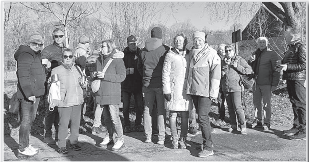
Wanderung nach Rhüden zur Weihnachtsfeier.