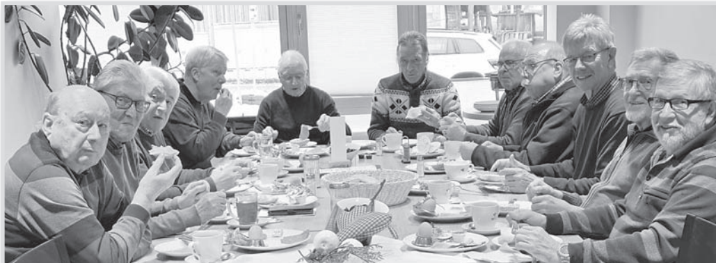
Die aktuellen sowie ehemaligen Ü70-Tennis-Senioren trafen sich am 15. Januar, wieder zum ersten gemeinsamen traditionellen monatlichen Frühstück im Café Brieske.

Die Ü70-Senioren schwingen auch im Winterhalbjahr das Racket. Seit der Wintersaison 2021/22 ist man mit einem Abo in Bad Salzdetfurth zu Gast. Jeweils montags von 10 bis 12 Uhr, außer in den Ferien, wird in der 3-Feldhalle des Tennisverbandes Niedersachsen-Bre-