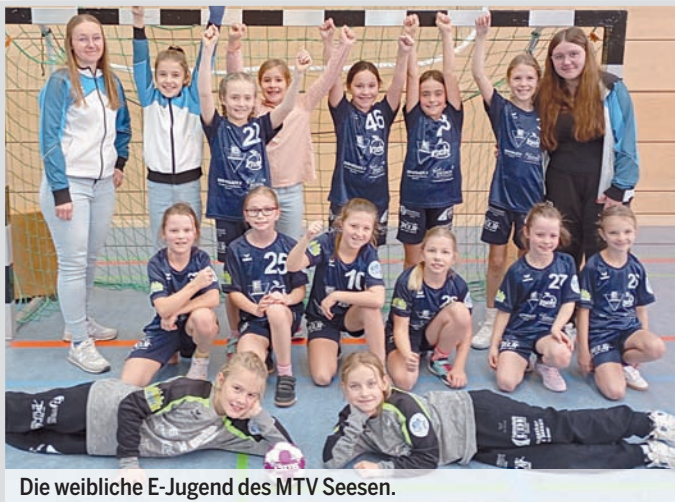
Die weibliche E-Jugend des MTV Seesen.