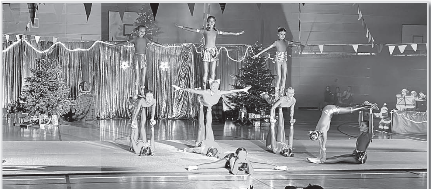
Beeindruckende Figuren zeigten die Sportler.