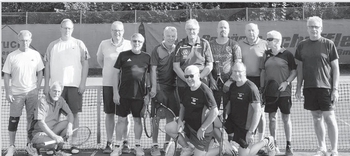
Unsere Tennisherren Ü70 waren am 22. August 2024 zum freundschaftlichen Vergleich beim TV Gittelde zu Gast. Das erste Treffen fand übrigens am 29. August 2022, auf Drei-Platz-Anlage „Am Sportzentrum“ in Gittelde statt.