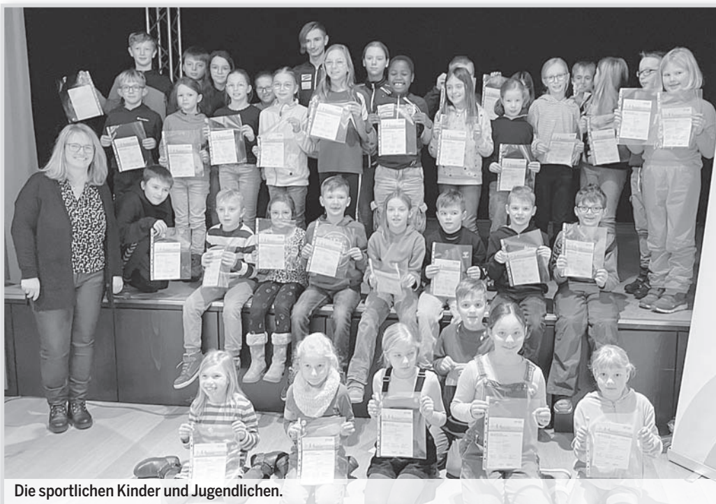
Die sportlichen Kinder und Jugendlichen.